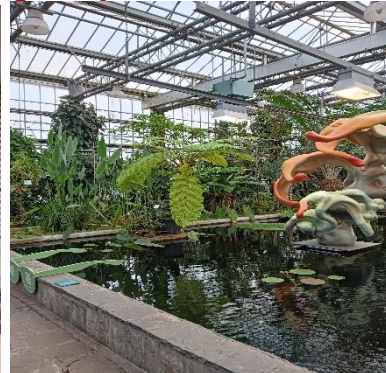
Plantentuin U Gent